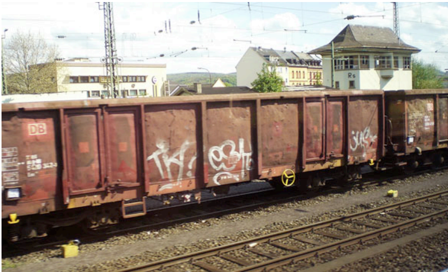
Bild : Der überwiegende Teil der Güterwaggons der Deutschen Bahn AG ist technisch überaltert und verursacht Lärmemissionen, die – wie Messungen im Mittelrheintal gezeigt haben – häufig weit über 100 Dezibel liegen.

Frei zur Veröffentlichung / Belegexemplar erbeten